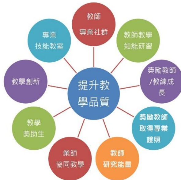
圖 3-2 提升教學品質架構圖

為了輔助教師持續精進教學，給予教師更多進修所需專業能力的資源。透過相同專業領域教師組成教師社群，分享各自的教學經驗與資源，將教師的教學能力進行整體的提升；並由各學院針對教師專業，擬定精進研習計畫，透過工作坊與研習會，或至校外參與專業的研習活動；獎勵教師(教練)自主成長，至國內外學習及取得專業證照；搭配業師協同教學及教學獎助生，達到教學相長；規劃提升教室教學環境及設備並推廣專業技能教室使用，提升教學成效貼近產業趨勢，藉以提升教師專業知能，給予學生更專業、精深的知識，提升教學品質架構圖(如圖 3-2)。