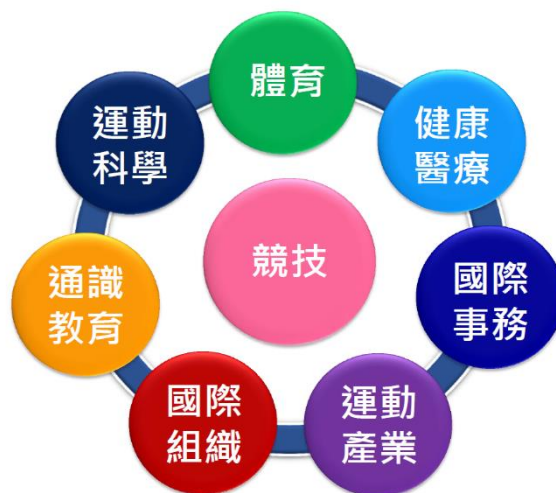
圖 2-2 國立體育大學系統性支持運動競技發展

體育大學不僅成為引領體育高等教育的領頭羊，亦成為奧運奪牌的火車頭。本校具備連結師資、教練、課程、設備、環境等要素，以及連結校內院系所的能量，以建構完整的運動組訓能量之能力，系統性支持運動競技發展(如圖 2-2)。學校發展透過培育優秀運動選手、更新訓練環境、整合區域訓練需求到辦理國際競賽活動，輔以順應時代脈動，以創新、求變的精神，將累積的競技運動訓練與科學研究成果，整合數位科技技術加以運用，將能展現我校之競技特色。