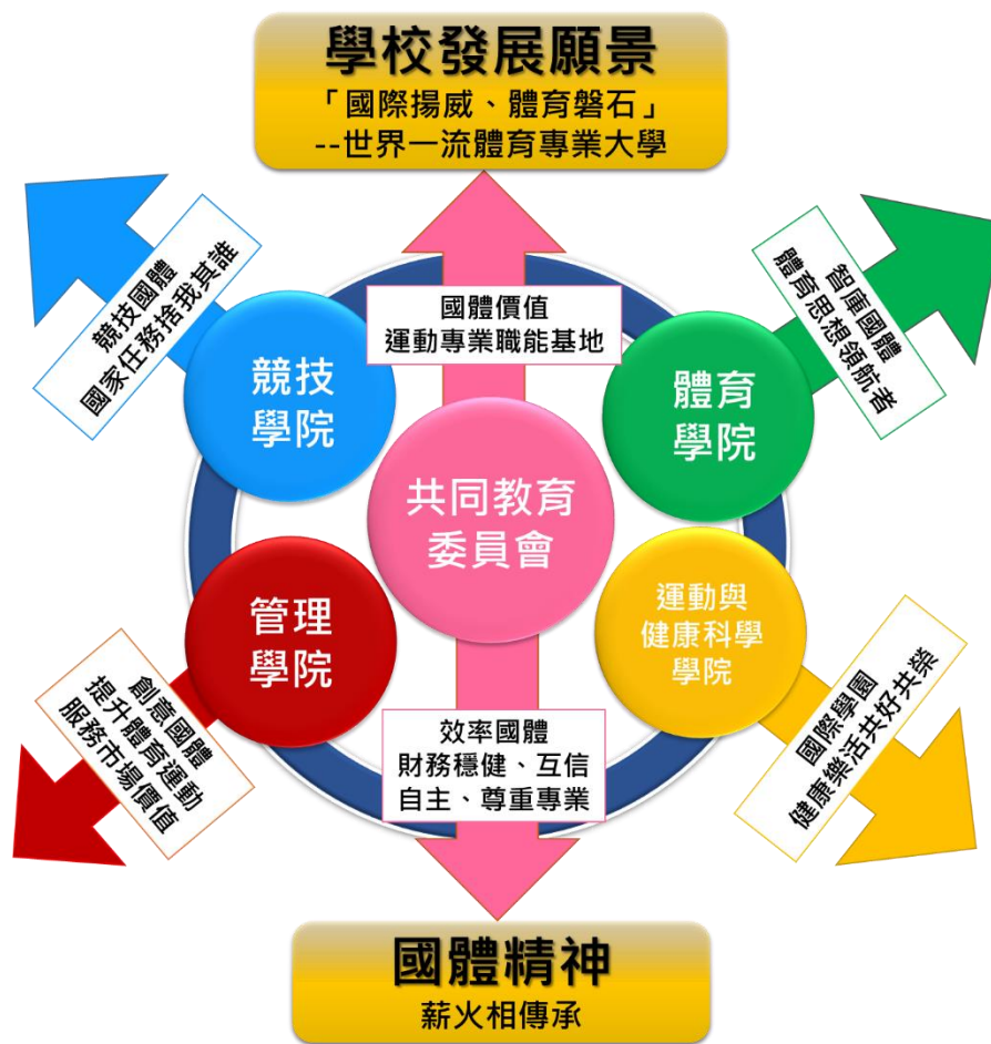
圖 1-1 學校願景與校務發展目標示意圖